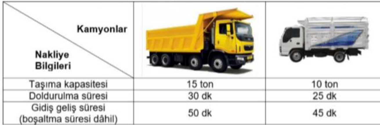
Tablo: Farklı tonajdaki kamyonların çalışma periyotları:

Rize ilinde yapılan bir dolgu sahasında çalışan iki farklı tonajlı kamyonun çalışma periyotları tabloda verilmiştir.